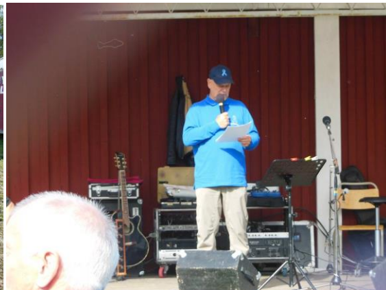
Prostatacancer info på mässan

Dessutom har vi haft 8 stycken torsdagsträffar.